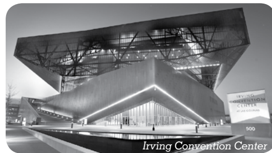
Irving Convention Center

The 2012 State of the City dinner is set for Jan. 31 at the Irving Convention Center at Las Colinas, 500 W. Las Colinas Blvd. For ticket information, visit www.irvingchamber.com or call (214) 217-8484.